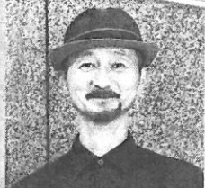
2017年3月 「牧師志願科」卒業